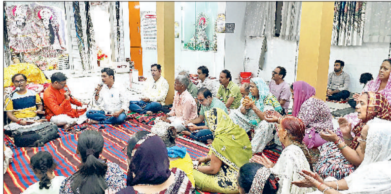
झज्जर। बाबा कांशीगिरी मंदिर में भजनों का आनंद लेते हुए श्रद्धालु।