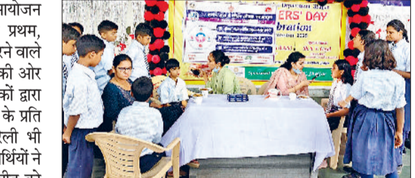
झज्जर। विद्यार्थियों की दंत जांच करते हुए चिकित्सकमी।