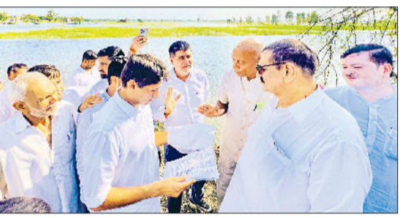
कहा कि आगामी 19 सितंबर को झज्जर जिले की जिला विकास समन्वय एवं निगरानी समिति की बैठक में जलनिकासी की स्थिति और खेतों के नुकसान की सारी रिपोर्ट रखने के निर्देश अधिकारियों को दिए हैं। जलनिकासी के काम में किसी भी प्रकार की लापरवाही बर्दाश्त नहीं होगी। सभी

अधिकारियों की जिम्मेदारी तय की जाएगी। दीपेंद्र ने कहा कि हरियाणा में बाढ़ से निपटने में सरकार पूरी तरह विफल साबित हुई है। खेतों व कॉलोनीयों में भरे पानी को जल्द निकालकर सामान्य जनजीवन बहाल किया जाए। संक्रामक बीमारियों की रोकथाम के लिए युद्धस्तर पर दवाइयों का