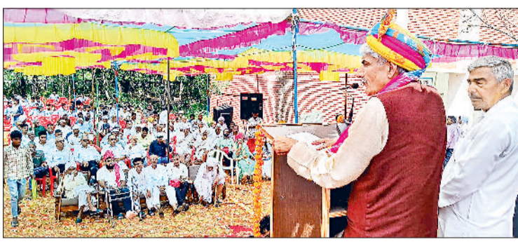
झज्जर। कार्यक्रम के दौरान उपस्थित लोगों को संबोधित करते हुए मुख्यातिथि।

विद्यार्थियों को प्रेरित करते हुए कहा कि अध्यापकों के प्रति श्रद्धा, सीखने की ललक तथा लक्ष्य के प्रति समर्पण से कठिन से कठिन डगर आसान की जा सकती है।