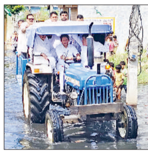
बहादुरगढ़। ट्रैक्टर पर सवार होकर छोटूराम नगर का जायजा लेते दीपेंद्र हुड्डा व खेतों में भरे जलभराव को लेकर ग्रामीणों से जानकारी लेते सांसद दीपेंद्र हुड्डा।

सांसद दीपेंद्र हुड्डा ने बुधवार को जलभराव से प्रभावित छोटूराम नगर व विवेकानंद नगर के साथ ही गांव कुलासी, जसौर और खेड़ी का दौरा किया। लोगों की परेशानियों को देखते हुए उन्होंने मौके पर ही डीसी से बात की और युद्धस्तर पर जलनिकासी कराने के साथ ही पीने के पानी के लिए एमपी कोटे के खर्च से 5 वॉटर टैंकर तुरंत लगवाने का निर्देश दिया। दीपेंद्र हुड्डा स्वयं ट्रैक्टर चलाते हुए जलभराव से बुरी तरह प्रभावित इलाकों में पहुंचे और प्रभावित लोगों की समस्याओं को सुना। उन्होंने