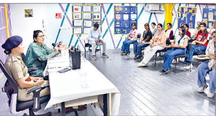
झज्जर। महिलाओं को संबोधित करते हुए पुलिस आयुक्त डॉक्टर राजश्री सिंह।

झज्जर। बुधवार को वेयरहाऊस में कार्य करने वाली महिलाओं को उनके अधिकारों, पुलिस द्वारा दी जाने वाली सुविधाओं, नशे के दुष्प्रभाव, यातायात नियमों की पालना करना और साइबर फ्रॉड से बचने के प्रति जागरूक किया गया। पुलिस आयुक्त डॉक्टर राजश्री सिंह ने बताया कि हरियाणा पुलिस की ट्रिप मॉनीटरिंग सेवा जो महिलाओं को 112 से जोड़कर उनकी यात्रा को सुरक्षित बनाती है। किसी भी कार्य के लिए घर से बाहर गई महिलाएं इस सेवा का उपयोग कर सकती हैं। इसके लिए डायल 112 पर फोन करके अपनी यात्रा का विवरण बताया जाएगा। इसके उपरांत डायल 112 की टीम द्वारा महिला के मोबाइल पर व्हाट्सएप मैसेज भेजा जाएगा।