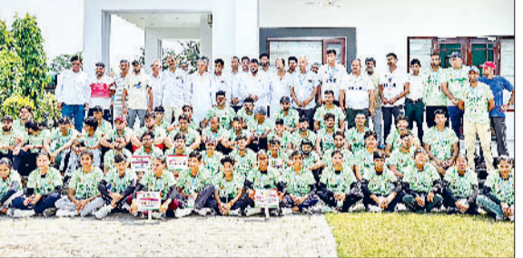
झज्जर। विजेता खिलाड़ियों के साथ एमेच्योर शूटिंग बॉल एसोसिएशन के पदाधिकारी।