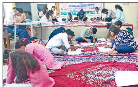
बहादुरगढ़। विभिन्न गतिविधियों में भाग लेते कॉलेज के छात्र-छात्राएं।